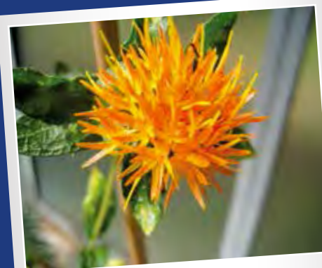
Cartamo di Recanati (MC)

Pomodoro di un colore giallo intenso con polpa consistente e ricca in zuccheri, molto adatto come base dei sughi di pesce. La sua coltivazione nella zona di Recanati risale a più di cinquanta anni fa e viene riprodotto abitualmente dalla Cooperativa Terra e Vita donatore del seme stoccato in Banca.