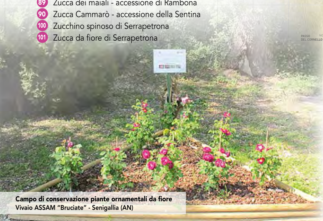
Campo di conservazione piante ornamentali da fiore Vivaio ASSAM "Bruciate" - Senigallia (AN)