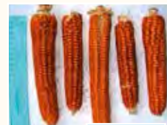
Ottofile Roccacontrada Tipologia: ARANCIO