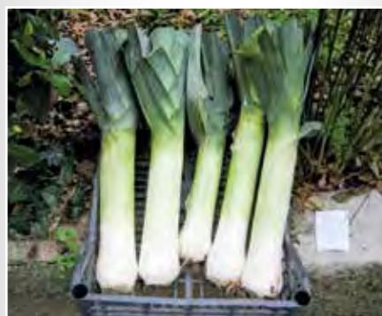
Porro di Massignano (AP)

L'azienda Ottaviani, donatrice dell'accessione, ne ricorda la diffusione da più di cinquanta anni. Interessante per il colore della farina.