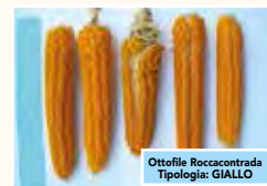
Ottofile Roccacontrada Tipologia: GIALLO