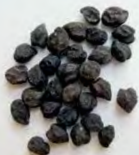
Cece Nero - Santa Vittoria (AP)