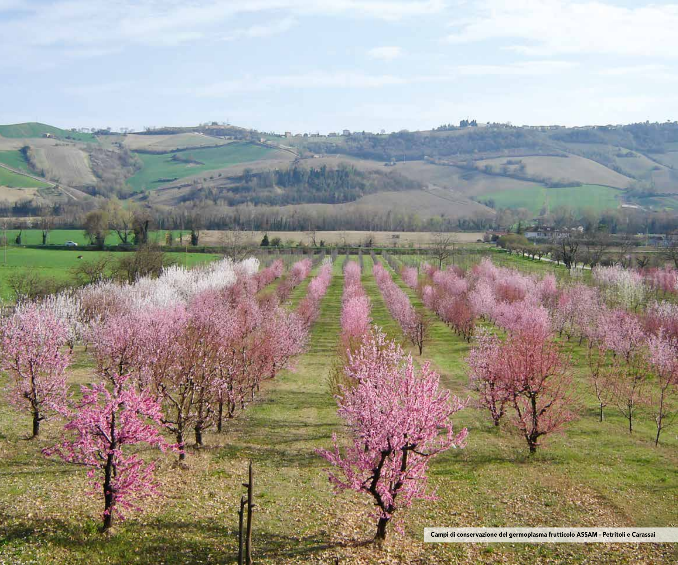
Campi di conservazione del germoplasma frutticolo ASSAM - Petritoli e Carassai