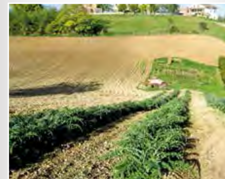
Carciofo di Urbisaglia (MC)

Accessione presente nella zona di Recanati fin dal 1930, risultano numerose testimonianze della sua coltivazione e del suo utilizzo nella preparazione del brodetto di pesce alla recanatese. Le testimonianze sono state fornite dalla Cooperativa Terra e Vita che lo coltiva e ne cura l'essiccazione.