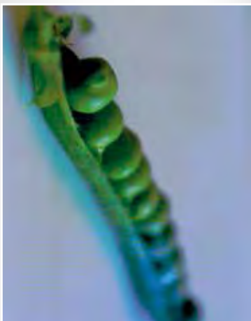
Pisello di Fratte Rosa (PU)