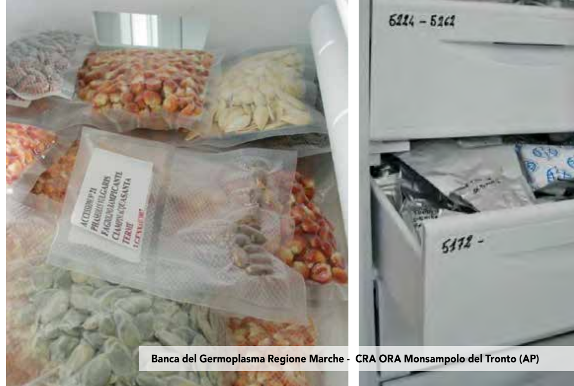
Banca del Germoplasma Regione Marche - CRA ORA Monsampolo del Tronto (AP)

L'Unità di ricerca di Monsampolo ha avviato nel giugno 2006 l'iter operativo, previa acquisizione di informazioni presso altre Banche del germoplasma, per l'identificazione e l'acquisto delle attrezzature indispensabili per la costituzione della Banca del germoplasma, avvalendosi di collaudati protocolli operativi come quello dell'IPGRI, oggi Biodiversity International.