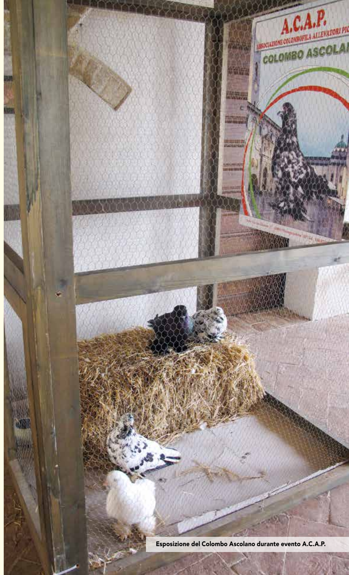
Esposizione del Colombo Ascolano durante evento A.C.A.P.