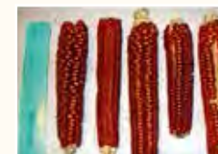
Ottofile Roccacontrada Tipologia: ROSSO