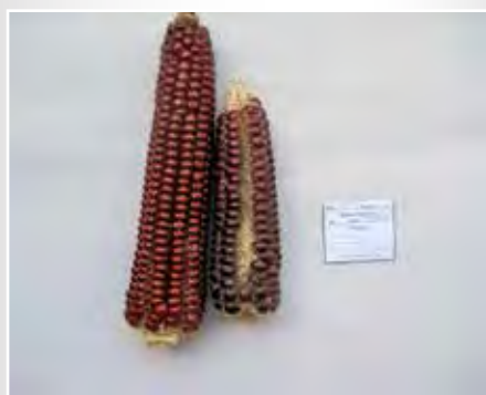
Mais vinaccia - Sassoferrato (AN)