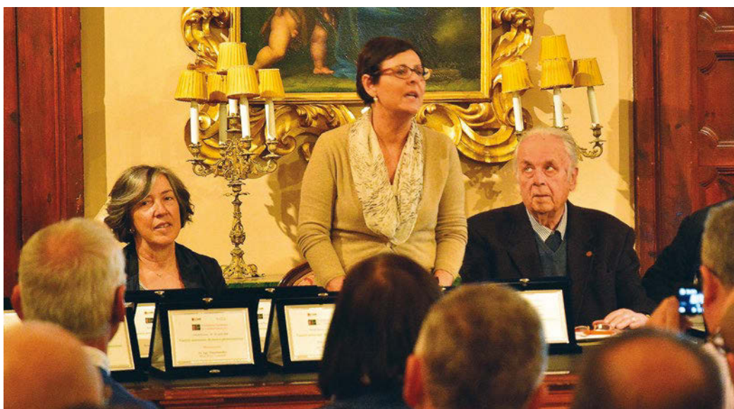
▲ Un momento del Convegno tecnico della Rassegna, Ascoli Piceno 23 Aprile 2016.

Sulla base delle analisi statistiche (cluster analysis) effettuate da Massimiliano Magli dell'IBIMET CNR di Bologna, applicate su tutti i campioni ammessi alla rassegna negli anni 2006-2016 con un punteggio al Panel test maggiore o uguale a 7, sono state definite 6 tipologie sensoriali che consentono di semplificare il variegato mondo di profumi e sapori degli oli italiani; nonostante ciascun monovarietale abbia delle sue specifiche peculiarità, la semplificazione consente di andare incontro alle esigenze degli chef che nelle loro creazioni gastronomiche vanno alla ricerca di una determinata tipologia di olio su un piatto specifico, ma anche dei consumatori più attenti ed esigenti, curiosi di scoprire sensazioni particolari, in base alle proprie preferenze e alla possibilità di abbinare l'olio tipico al piatto/prodotto tipico, con una attenzione crescente agli aspetti nutrizionali e salutistici. Le tipologie vanno da oli più delicati e man-