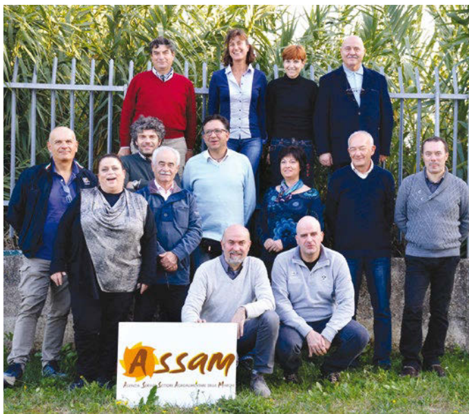
▲ Panel regionale "ASSAM - Marche".

per la Rassegna 2017, che ha visto la partecipazione di ben 199 campioni di olio, con un livello qualitativo ben oltre le aspettative.