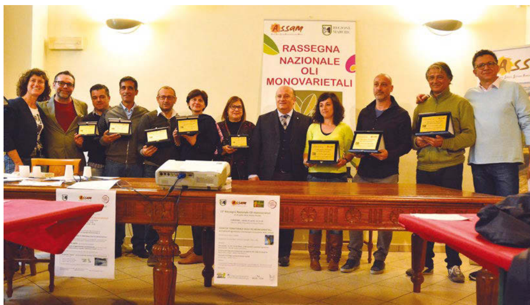
▲ Vincitori nona edizione del gioco a squadre "Indovina la varietà", Ascoli Piceno 24 aprile 2016.

Ciascun olio è stato assaggiato da 8 componenti del Panel utilizzando una scheda di caratterizzazione degli oli monovarietali, appositamente predisposta dall'ASSAM, su scala continua da 0 a 10, che prevede l'esame visivo, olfattivo e gustativo-tattile-retrofattivo. I 199 campioni pervenuti alla Rassegna sono